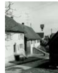
Blick Richtung Norden auf Höhe Gebäude 11, 1969