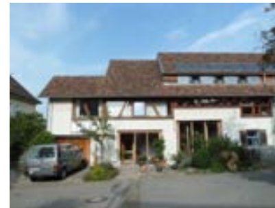
Westansicht mit dreistufigem Dach