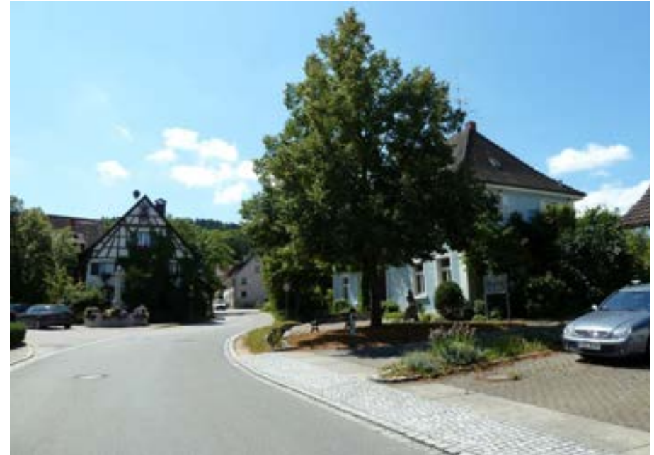
Schienerbergstraße auf Höhe der Hausnummer 24a, Blick nach Süden