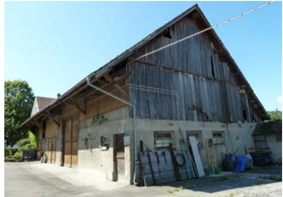
Nordostansicht mit Giebel in senkrechter Bretterschalung