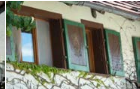
Klappläden und Fenstereinfassung aus Holz