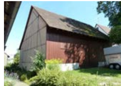
Nordostansicht der Scheune