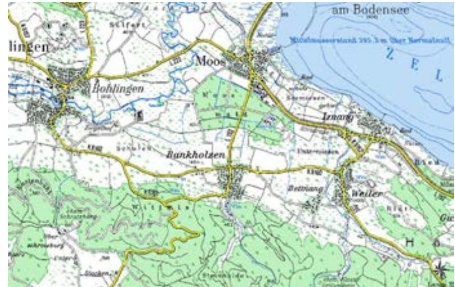
Abb. 1: Topographische Karte Bankholzen (1:25.000)

Die Entfernung von Bankholzen bis zum Ufer des Bodensees beträgt etwa einen Kilometer.