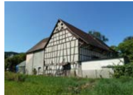
Nordostansicht des Ökonomieteils