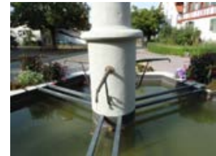
Ansicht des Beckens und der Wasserspeier