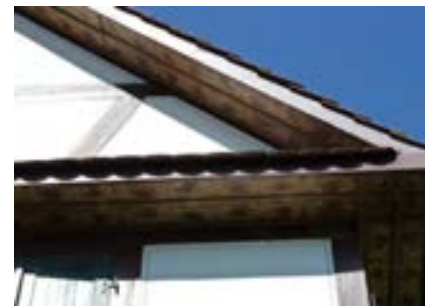
Detail im Traufbereich der Ostseite