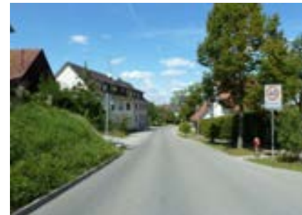
Schienerbergstraße am südlichen Ortsrand, Blick nach Norden