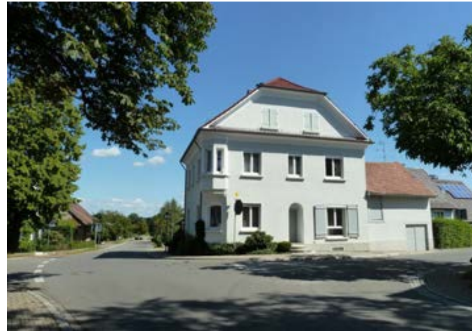
Südansicht, links die Straße nach Moos, rechts die Straße nach Weiler