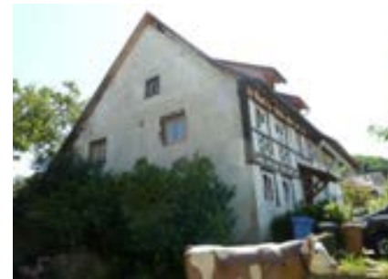
Nordwestansicht des ehemaligen Wohnteils