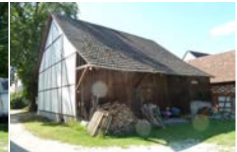
Südostansicht der Scheune