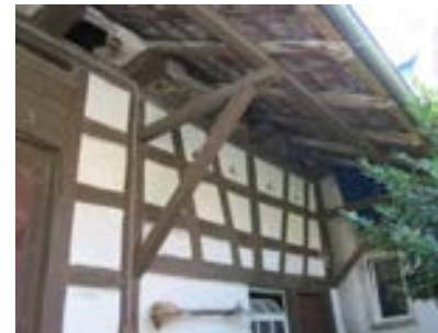
Westansicht des Ökonomieteils