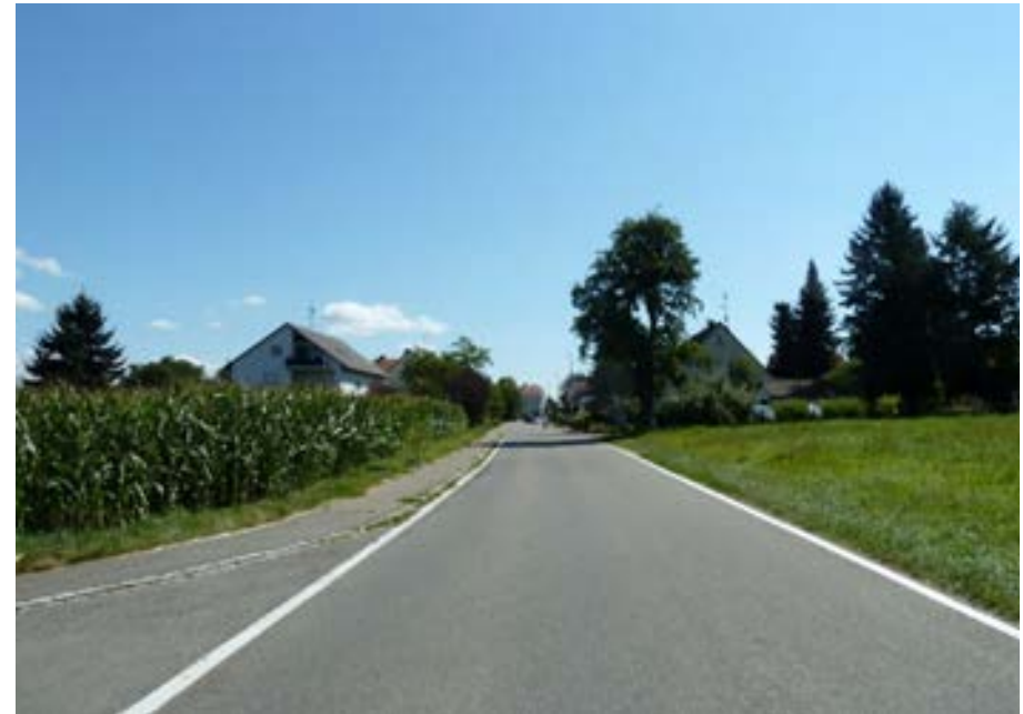
Hegaustraße am westlichen Ortseingang, Blick nach Osten