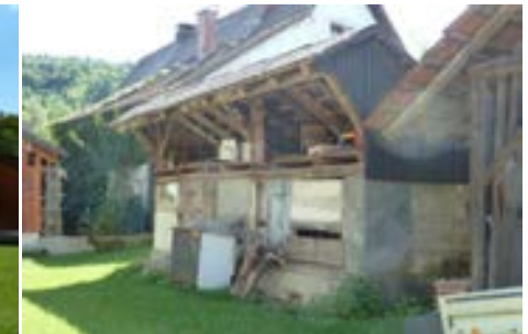
Rückwärtig liegender ehemaliger Schweinestall