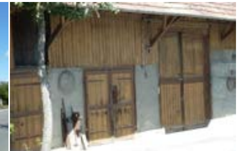
Holzttore an der Ostseite