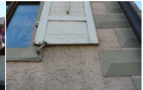
Holzklappläden und Diamantquadereckverzierung