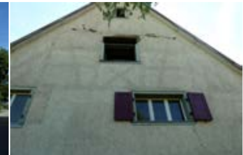
Nordansicht mit sich abzeichnendem Fachwerk