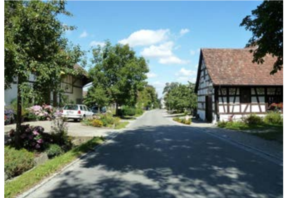
Schienerbergstraße auf Höhe der Hausnummer 15, Blick nach Norden