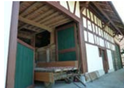
Westansicht mit Blick in den Ökonomieteil