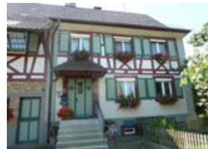
Nordansicht des Wohnteils