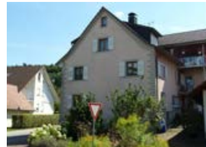
Nordwestansicht mit jüngerem Anbau