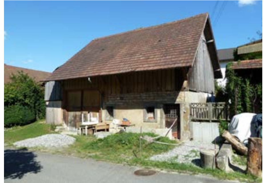
Südwestansicht der Scheune