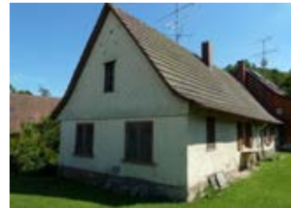
Nordwestansicht des Wohnteils