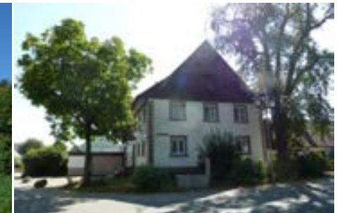
Westansicht mit Brunnen im Vordergrund