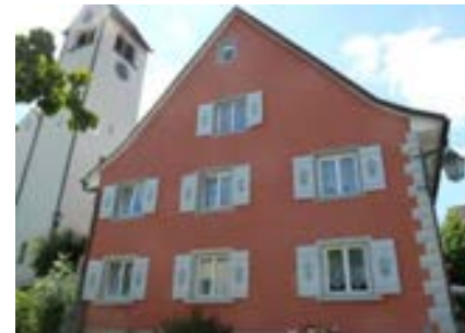
Ostansicht mit Kirche links