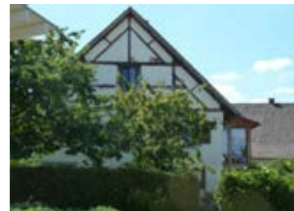
Ostansicht der erneuerten Giebelseite