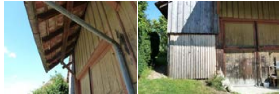
Dachuntersicht mit farbig gefasster Bretterschalung der Außenwand