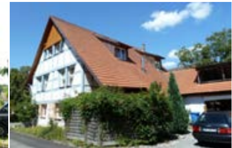
Südostansicht des ehemaligen Stallteils