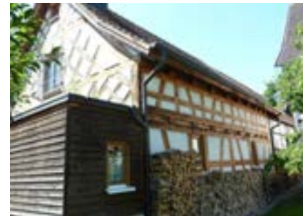
Nordostansicht des neuen Teils