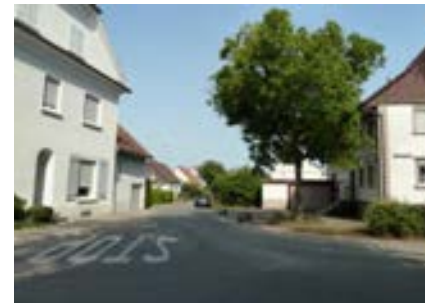
Kreuzung Schienerbergstraße nach Osten