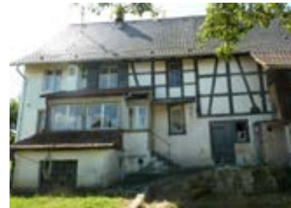
Nordansicht mit Kellerabgang