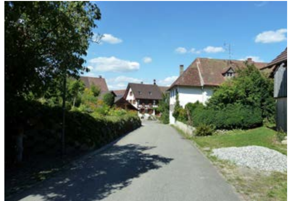
Blick Richtung Norden auf Höhe Gebäude 9