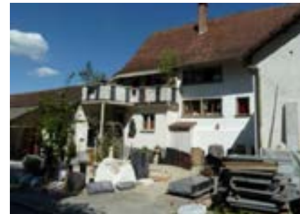
Westansicht mit jüngerem Anbau