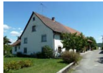
Blick nach Osten mit Heerenweg 1 im Vordergrund