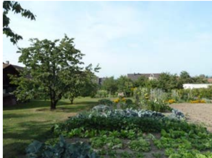
Abb. 6: Historischer Ortsrand, heute Gartenfläche im Bereich des Unterdorfs.

Insgesamt ist die Dichte an historischer Überlieferung sehr hoch. Dadurch ist die historische Siedlungsstruktur mit ihren wesentlichen Bestandteilen und ihren räumlichen Bezügen bis heute in bemerkenswertem Umfang ablesbar geblieben. Bankholzen gehört damit zu den am besten erhaltenen Ortskernen unseres Landes und weist damit aus denkmalfachlicher Sicht die Merkmale einer Gesamtanlage im Sinne des Denkmalschutzgesetzes auf. An ihrer Erhaltung besteht ein besonders öffentliches Interesse.