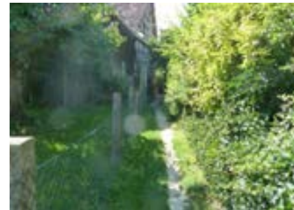
Historischer Weg, Blick nach Westen Richtung Schienerbergstraße 21a