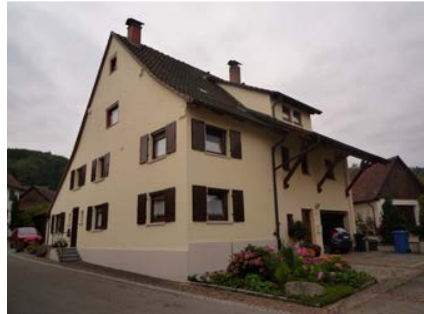
Nordostansicht des ehemaligen quergeteilten Einhauses