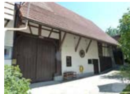
Westansicht des Ökonomieteils