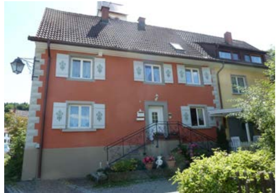
Nordansicht des ehemaligen Pfarrhauses