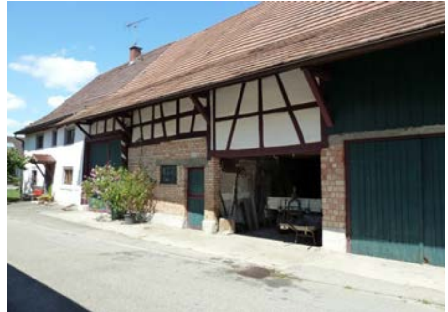
Südansicht mit Wohnteil links und Ökonomieteil rechts