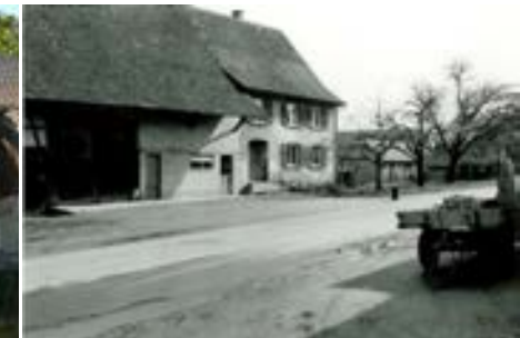
Südansicht Wohnhaus mit Scheunenteil, 1973