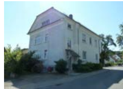
Nordwestansicht mit Kehlgesims