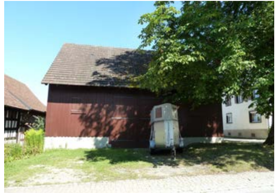
Westansicht der Scheune mit mittig angeordnetem, zweiflügeligem Holztor