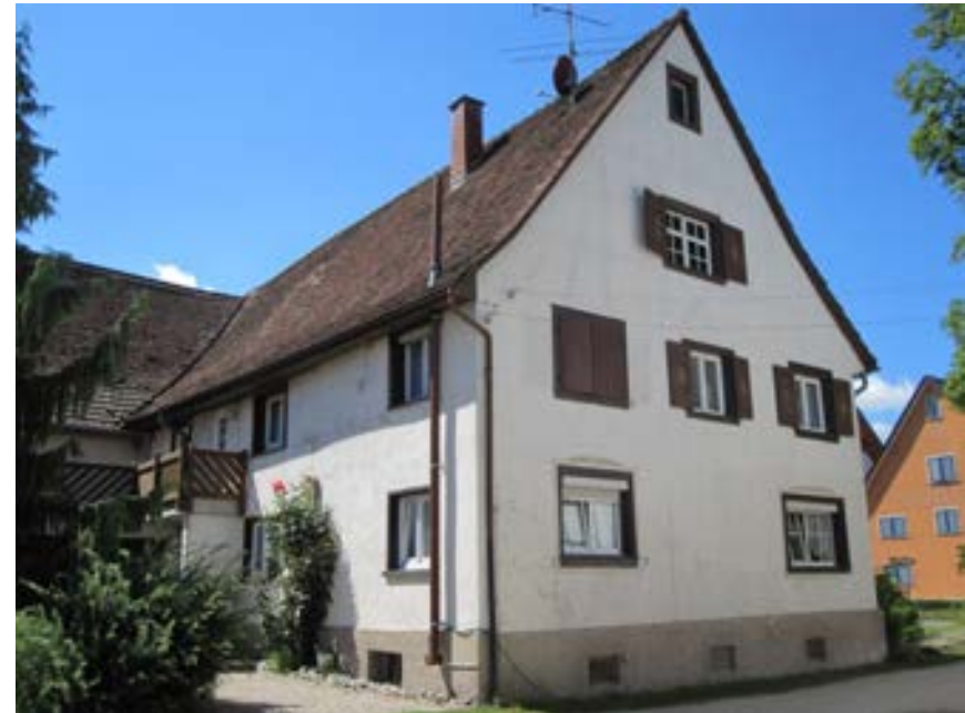
Nordostansicht des Wohnteils