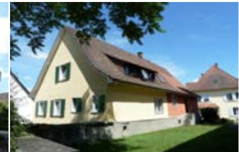
Südwestansicht des ehemaligen Ökonomieteils