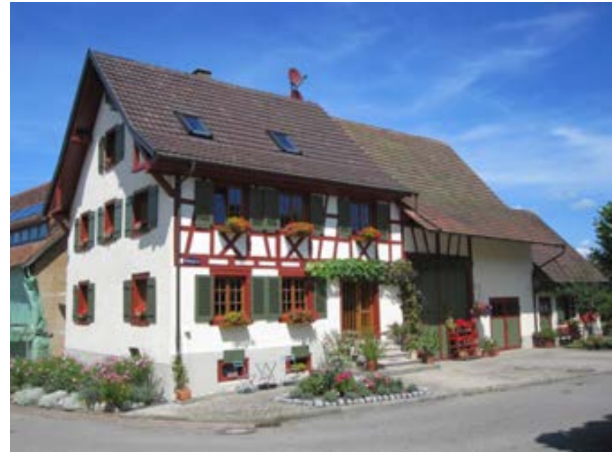
Südwestansicht mit Wohnteil, Scheune und Stall