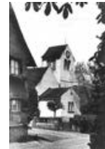
Ansicht der Kirche vor 1952