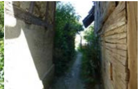
Historischer Weg auf Höhe Schienerbergstraße 21a, Blick nach Osten