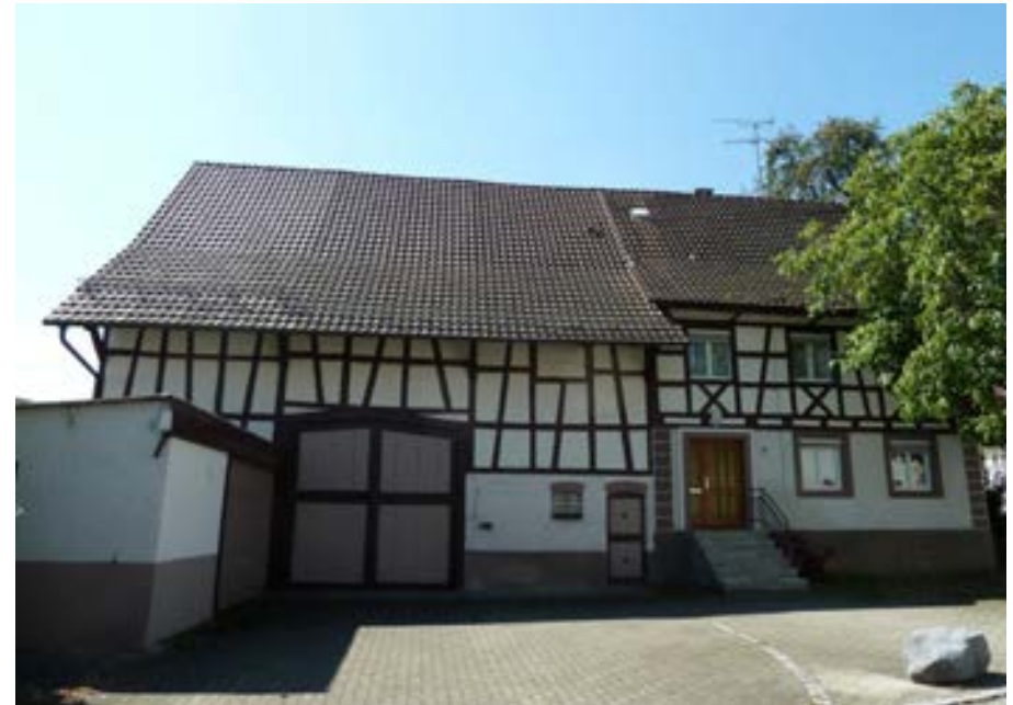
Nordansicht mit Ökonomieteil links und Wohnteil rechts