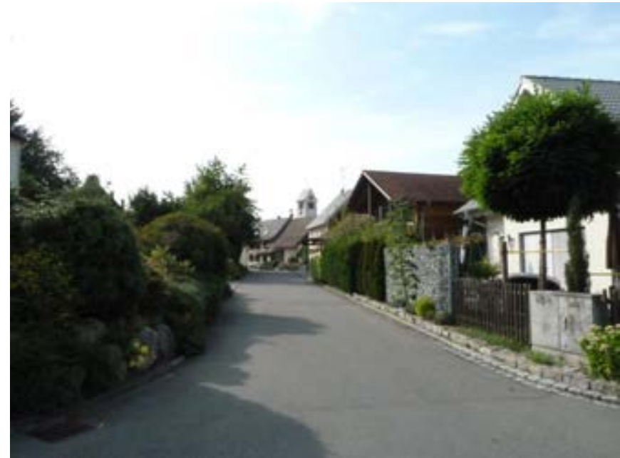
Blick Richtung Westen auf Höhe Gebäude 20