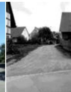
Blick nach Osten in den Heerenweg 1970