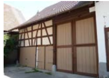
Westansicht der Scheune