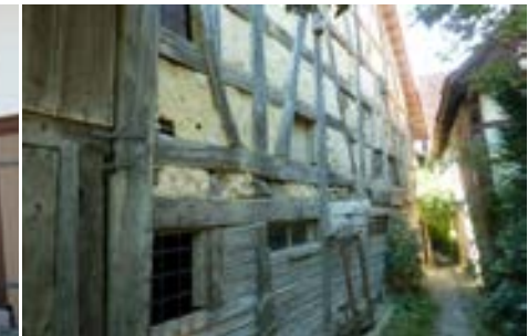
Nordansicht der Scheune mit freiliegenden Lehmgefachen