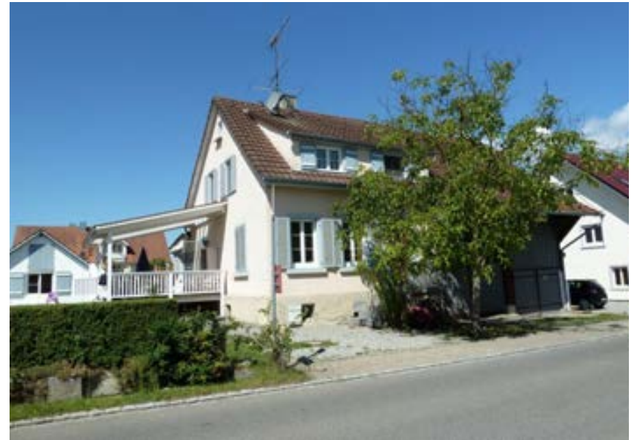
Südostansicht mit jüngerem Balkonanbau an der Südseite