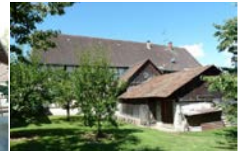
Ostansicht mit rückwärtigen Anbauten