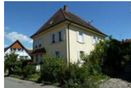
Südwestansicht des Pfarrhauses