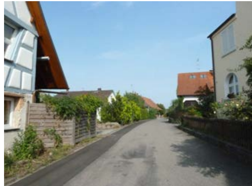
Blick von der Deienmooserstraße nach Osten in den Heerenweg, rechts das Pfarrhaus