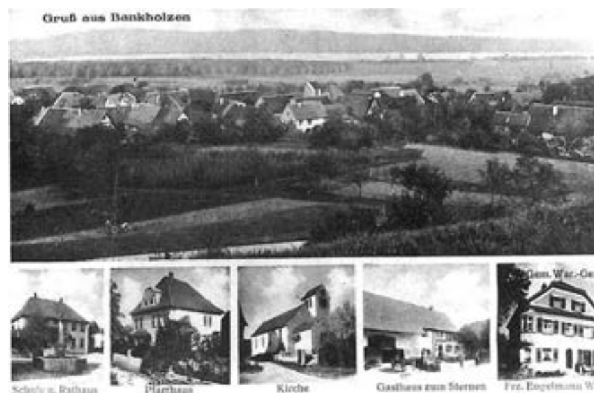
Abb. 3: Historische Postkarte um 1920.

1901 erhielten alle Gebäude Bankholzens im Zuge eines errichteten Wasserhochbehälters einen Wasseranschluss. Der Anschluss an das Stromnetz von Schaffhausen erfolgte 1922. Die 1960 östlich des Dorfkerns erstellten Neubauten sind seit ihrer Bauzeit an eine Abwasserleitung angeschlossen, die übrigen Gebäude Bankholzens folgten 1972 als der ganze Ort kanalisiert wird und die Ortstraßen mit Namen versehen werden.