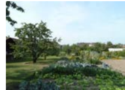
Als Gartenfläche genutzter ehemaliger Ortstrand