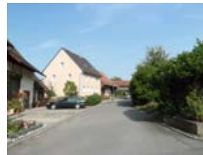
Blick nach Osten auf Höhe Gebäude 1