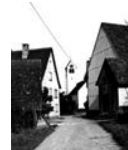
auf Höhe der Hausnummer 20, Blick nach Osten, 1968