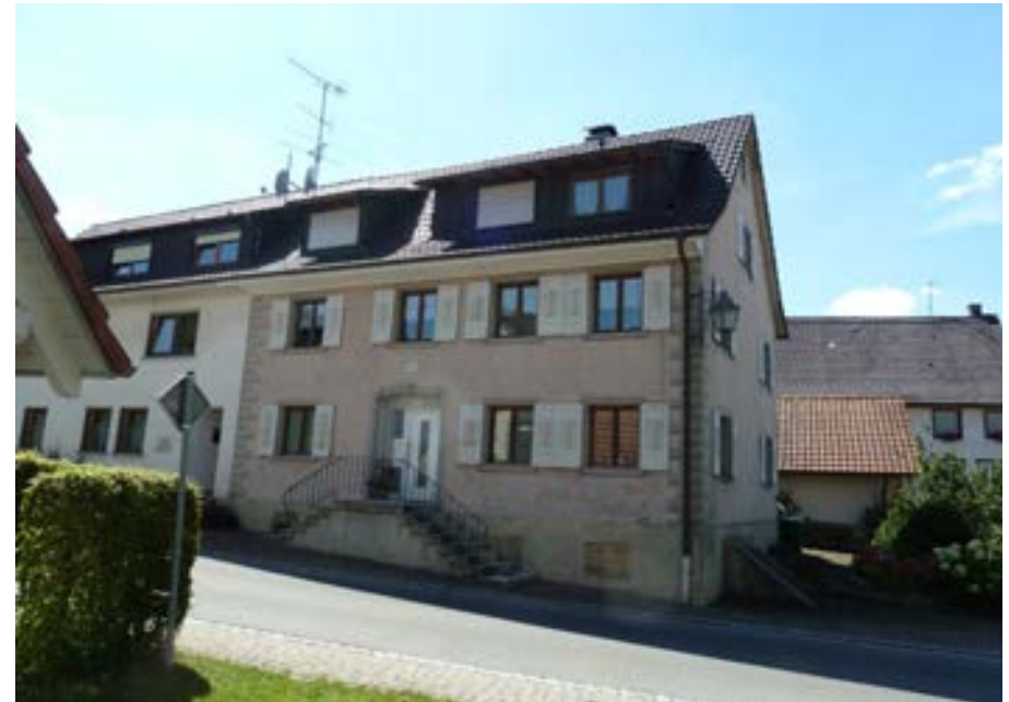
Südostansicht mit doppelläufiger Freitreppe