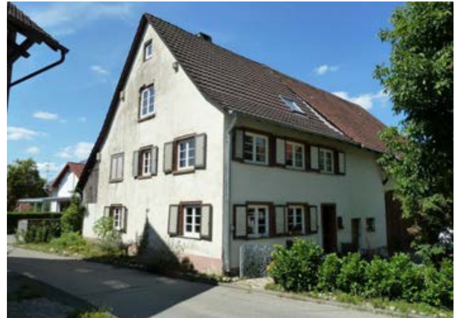
Südostansicht, an der Giebelseite zeichnen sich die Balkenköpfe der Fachwerkkonstruktion ab