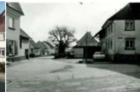
Kreuzung Schienerbergstraße, 1969