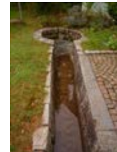
Vor der Schienerbergstraße 24 ist der Bachlauf noch sichtbar, danach verläuft er unterirdisch