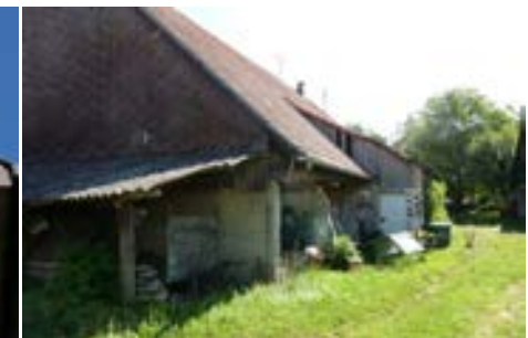
Südwestansicht mit rückwärtigen Anbauten