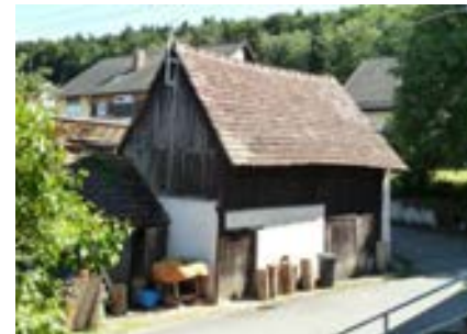
Nordwestansicht des Schuppens