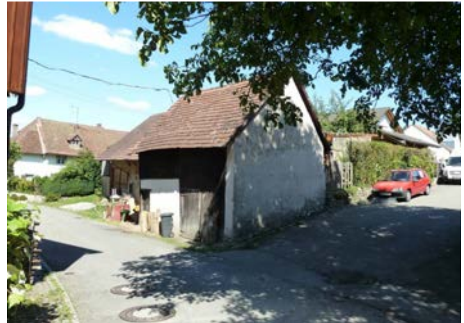
Südwestansicht des Schuppens