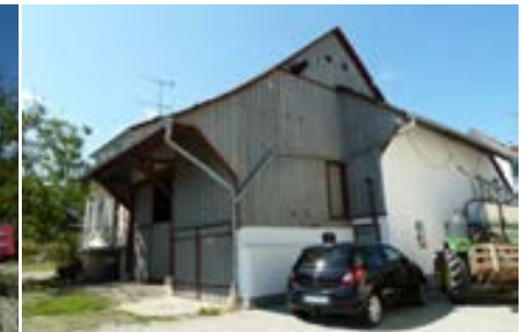
Nordostansicht des Ökonomieteils