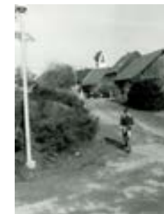
Blick von nach West auf Höhe Gebäude 20