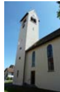
Nordansicht mit 1956 erhöhtem Turm