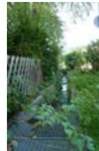
Blick nach Süden auf Höhe Vorderer Hörstraße 2 mit offenem Bachlauf links der Straße