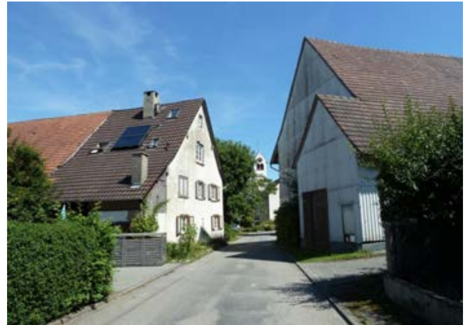
Im Winkel auf Höhe der Hausnummer 20, Blick nach Osten