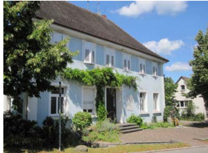
Ostansicht des ehemaligen Rat- und Schulhauses mit Brunnen (rechts)