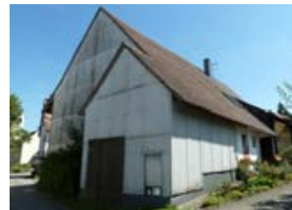
Nordwestansicht mit rückwärtigem Anbau