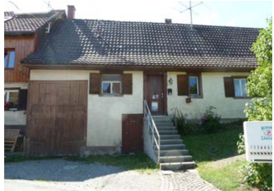
Ostansicht mit Ökonomieteil links und Wohnteil rechts