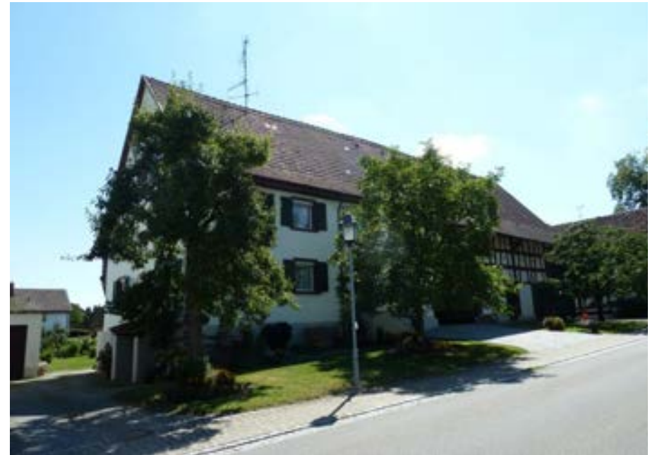
Nordwestansicht mit Wohnteil links und Ökonomieteil rechts