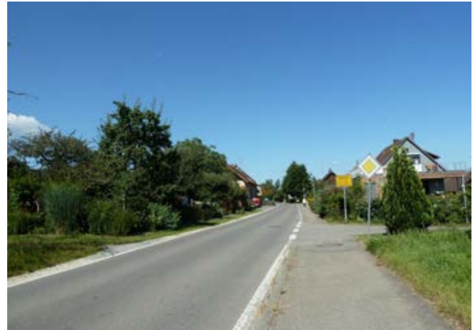
Vordere Hörstraße am östlichen Ortseingang, Blick nach Westen