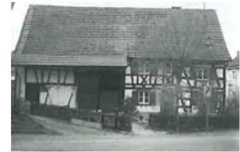
Ansicht Ost, 1997