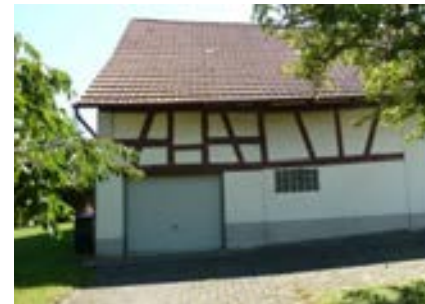
Westansicht des Ökonomieteils