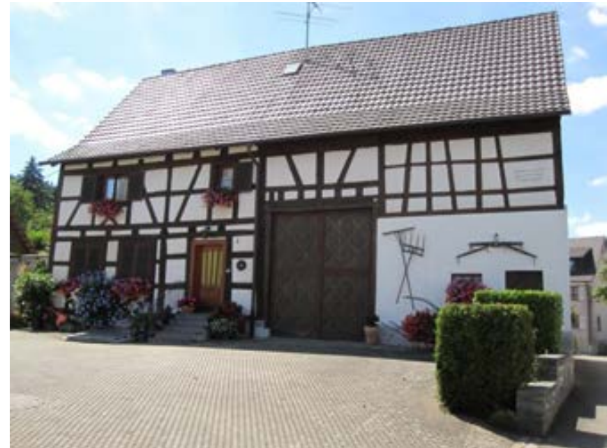
Ostansicht des quergeteilten Einhauses