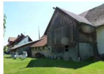
Nordansicht mit Rückwärtigen Anbauten