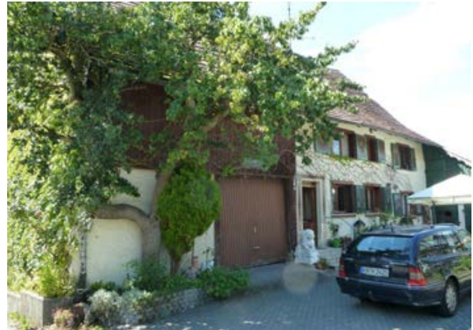
Ostansicht, links der Ökonomieteil, rechts der Wohnteil