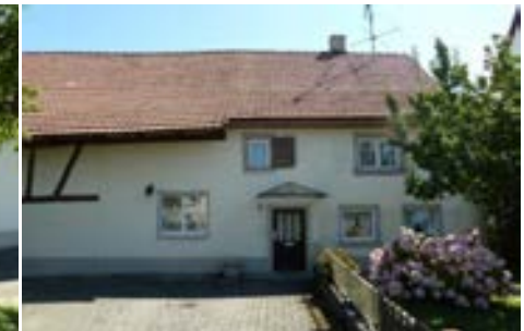
Westansicht des Wohnteils