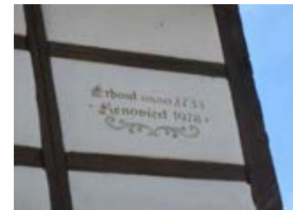
Inscript an der Ostseite