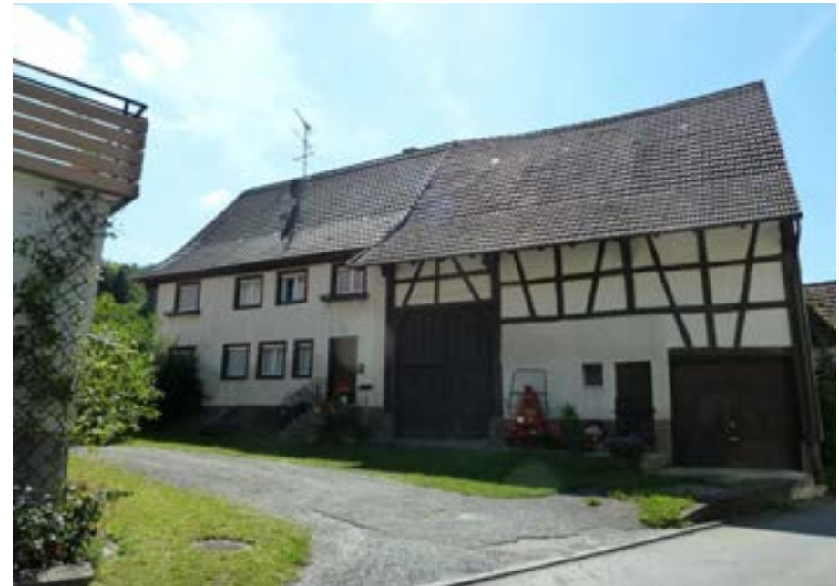
Ostansicht, links der Wohnteil, rechts der Ökonomieteil