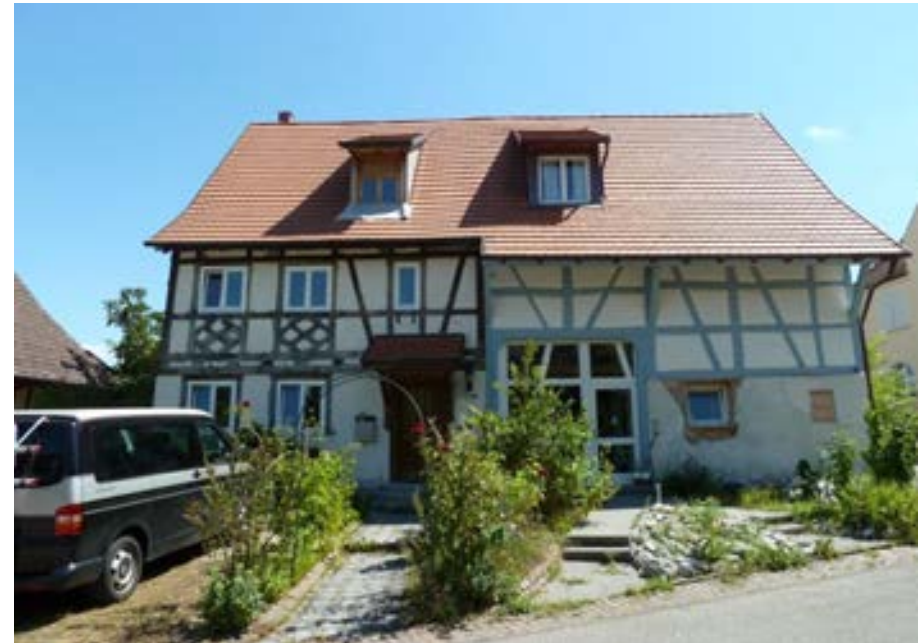
Westansicht, rechts der ehemalige Stallteil