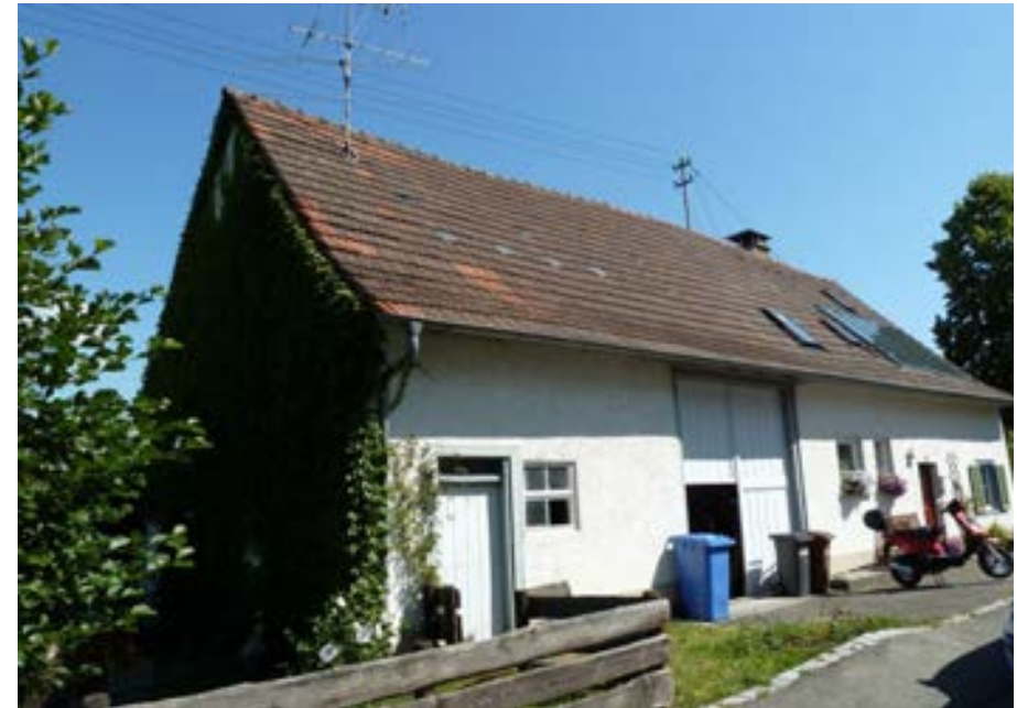
Südwestansicht mit Ökonomieteil links und Wohnteil rechts