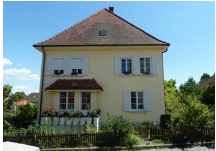
Westansicht des Pfarrhauses, heute ist hier der Kindergarten untergebracht