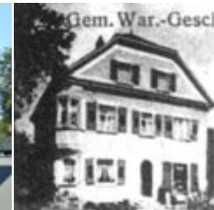
Südansicht um 1920