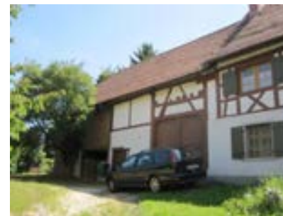
Nordansicht mit Ökonomieteil links