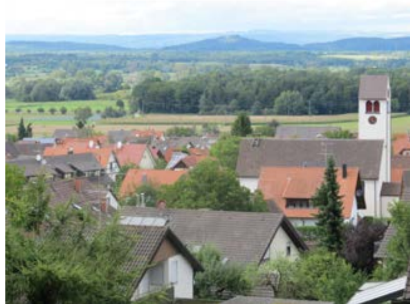
Abb. 5: Blick auf die Dachlandschaft Bankholzens von Süden nach Norden, rechts im Bild die katholische Pfarrkirche St. Blasius. Quelle: Gemeinde Moos, August 2012.

Besonders gut hat sich die ehemalige Haupterschließungsstraße mit einigen markanten Merkmalen erhalten. Sie hat eine platzartige Erweiterung mit einem Brunnen auf Höhe des ehemaligen Schul- und Rathauses. Die quergeteilten Einhäuser stehen hier leicht zurück versetzt von der Straße, wodurch eine optische Erweiterung des Straßenraumes entsteht. Außerdem wird der Straßenraum von dem, immer wieder straßenbegleitend offenliegenden, Nettenbach und den begrünten Vorbereichen mit ihrem teilweise alten Baumbestand geprägt. Durch eine leichte Kurve im Verlauf der Schienerbergstraße rückt der alte Dorfbrunnen von 1861 und das dahinter liegende Gebäude der Deienmooserstraße 2 in die Sichtachse. Andere optische Bezugspunkte sind selten im Verlauf der Straßen. Ein weiterer Brunnen wurde 1993 an Stelle eines ehemals zur Wasserentnahme vorhandenen errichtet. Er befindet sich ebenfalls in der Schienerbergstraße auf Höhe des Gebäudes Vordere Hörstraße 2.