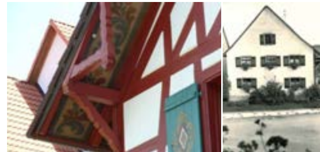
Detailansicht der Traufe