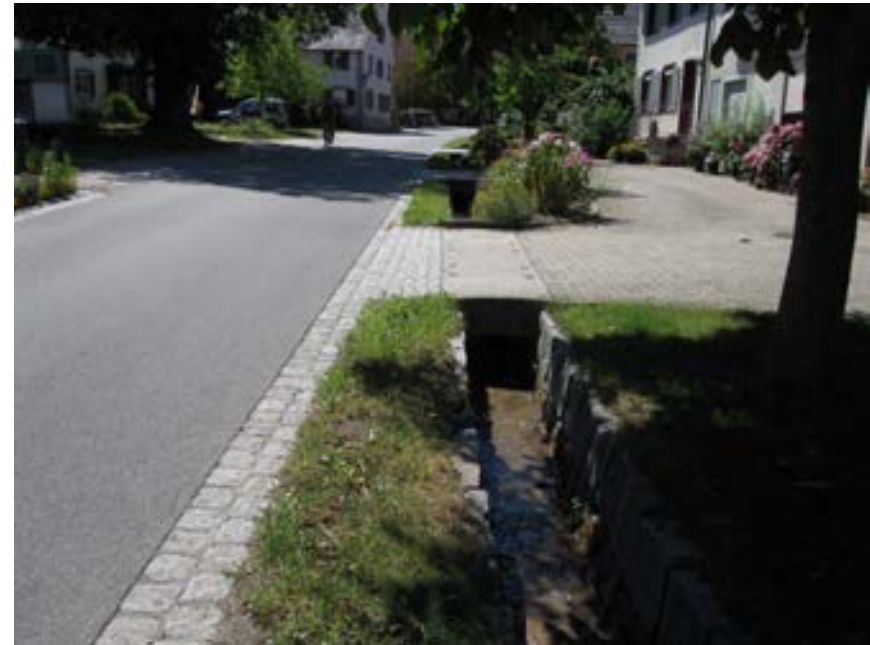
Blick nach Süden auf Höhe Schienerbergstraße 13a mit dem offenen Bachlauf rechts der Straße