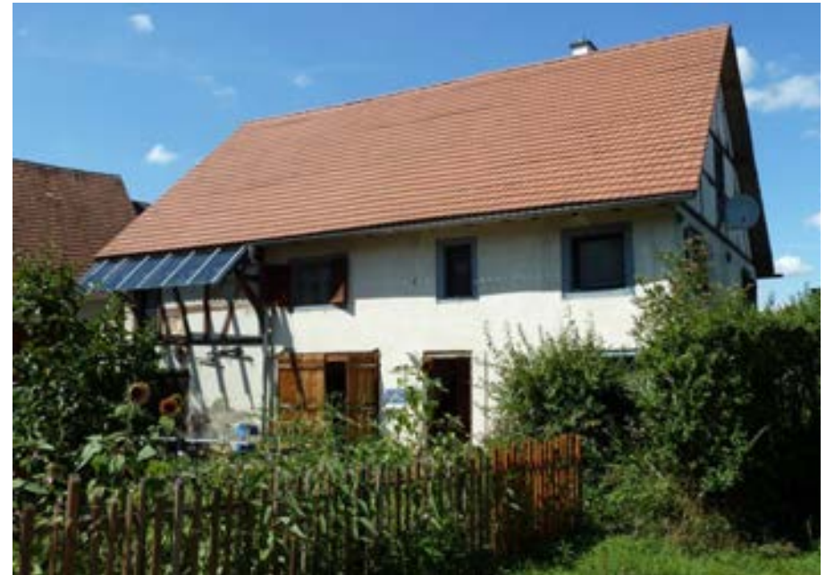
Südansicht des quergeteilten Einhauses