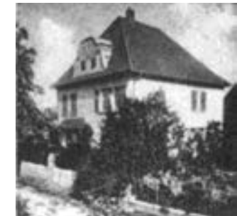
Pfarrhaus um 1920