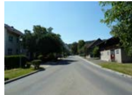
Schienerbergstraße (von Moos kommend) am nördlichen Ortseingang, Blick nach Süden