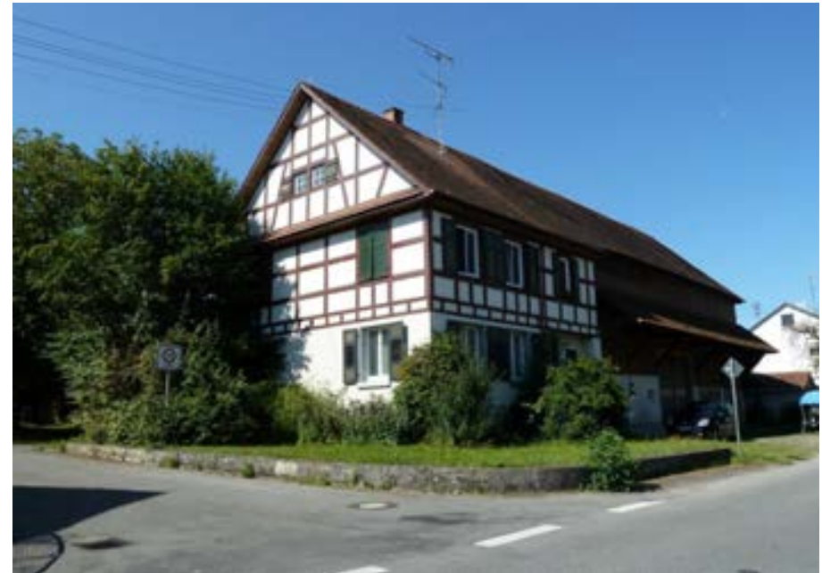
Nordostansicht mit Wohnteil links und Ökonomieteil rechts