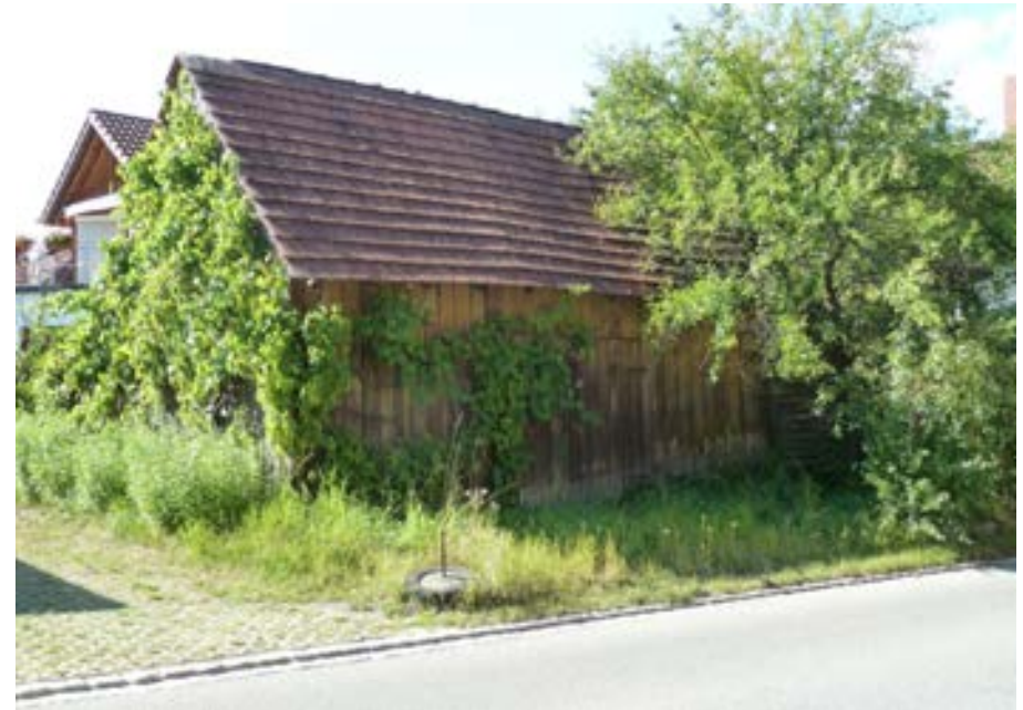
Südostansicht mit mittig angeordnetem, zweiflügeligem Holztor