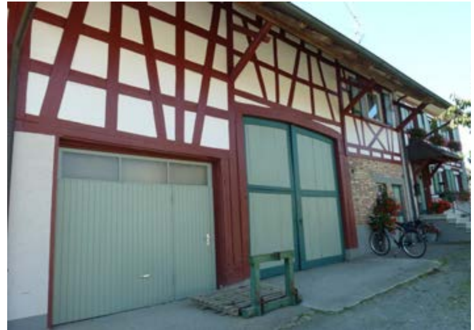
Nordansicht mit Ökonomieteil links und Wohnteil rechts