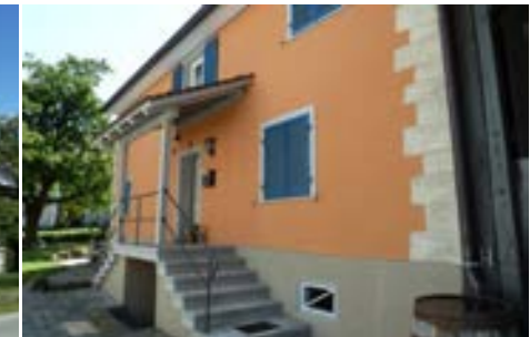
Treppenaufgang an der Nordseite