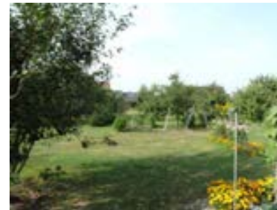
Als Streuobstwiese und Grünfläche genutzter ehemaliger Ortstrand