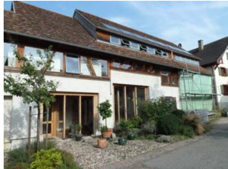
Westansicht des ehemaligen quergeteilten Einhauses