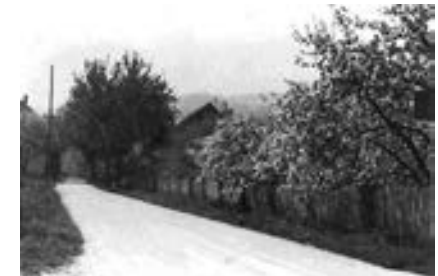
Schienerbergstraße am nördlichen Ortseingang, Blick nach Süden, 1960er Jahre