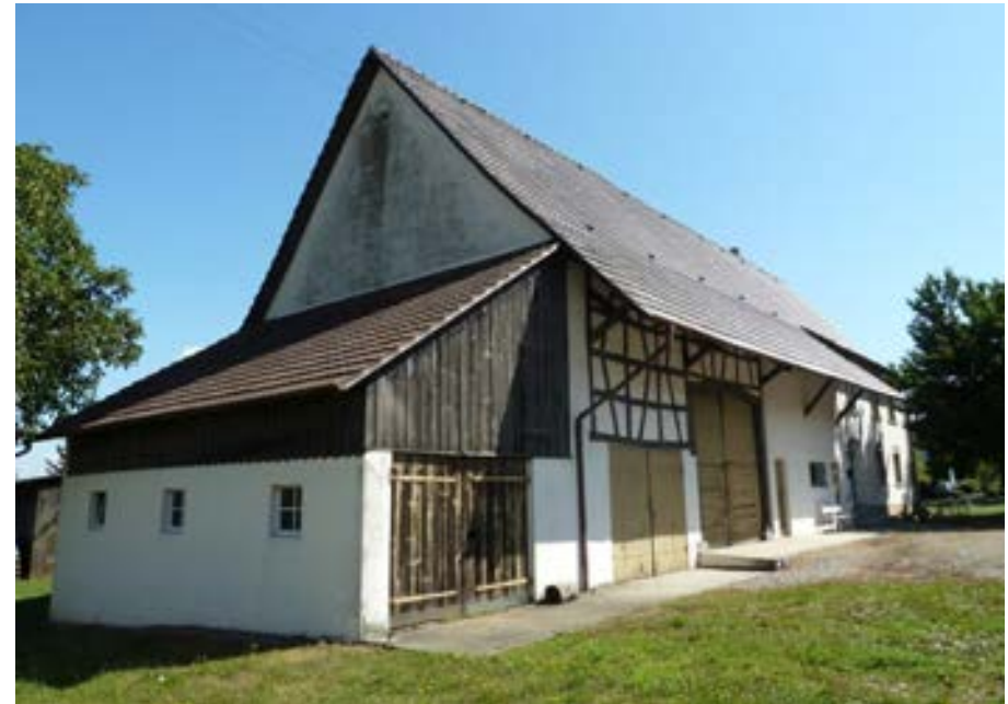
Südwestansicht, links der Ökonomieteil, rechts der Wohnteil