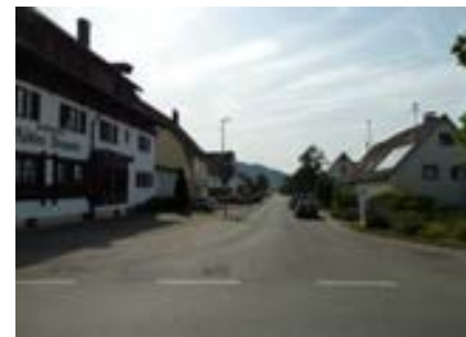
Blick auf Höhe Gebäude Nr 2 nach Westen