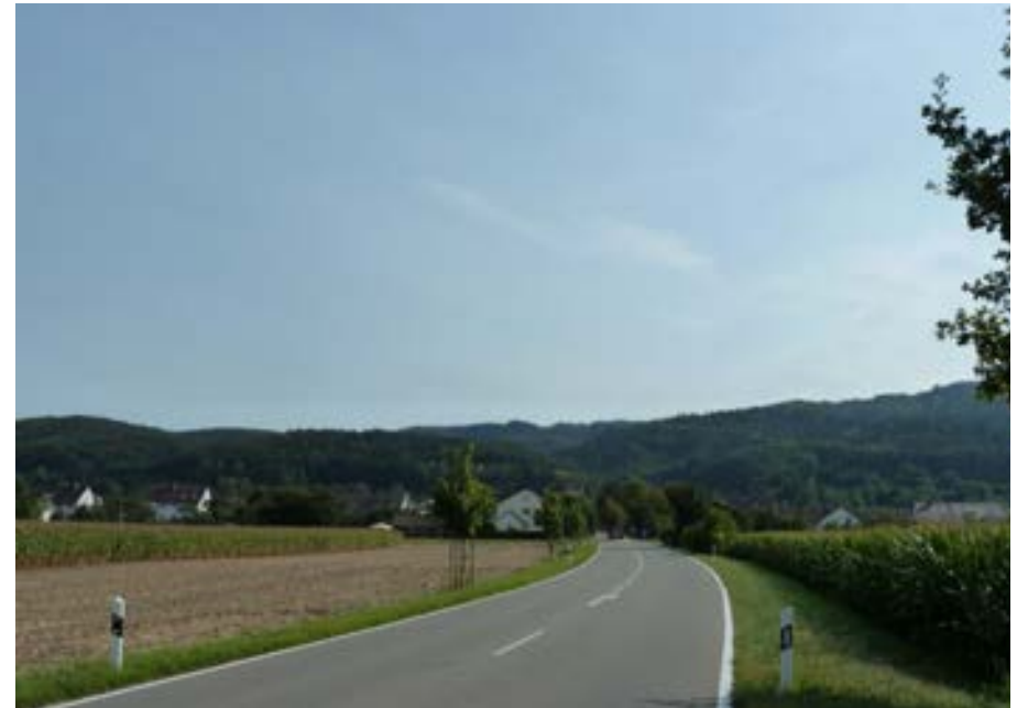
Der nördliche Ortstrand, Blick von der L193 aus nach Süden