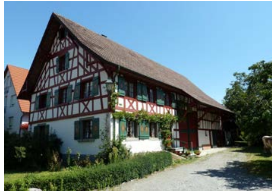
Südwestansicht des Quergeteilten Einhauses