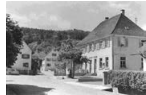
Nordostansicht vor dem Umbau 1960