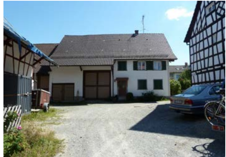
Westansicht des quergeteilten Einhauses, links anschließend die Scheune