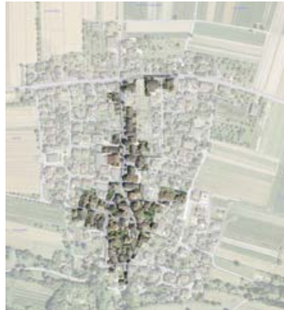
Abb. 4: Luftbildaufnahme mit Hervorhebung des historischen Ortskerns.

Charakteristische Freiflächen befinden sich meist im hinteren Bereich der Parzellen, hier lagen kleine Nutzgärten und Wiesen, die gleichzeitig den ehemaligen Ortsrand darstellten. Diese Aufteilung ist vor allem im Bereich östlich der Schienerbergstraße noch heute ablesbar. Die rückwärtig zur Bebauung der Haupteinfahrtsstraße liegenden Gärten sind erhalten und der Ortsrand wegen einer nicht vorhandenen Unterteilung weiter erfahrbar.