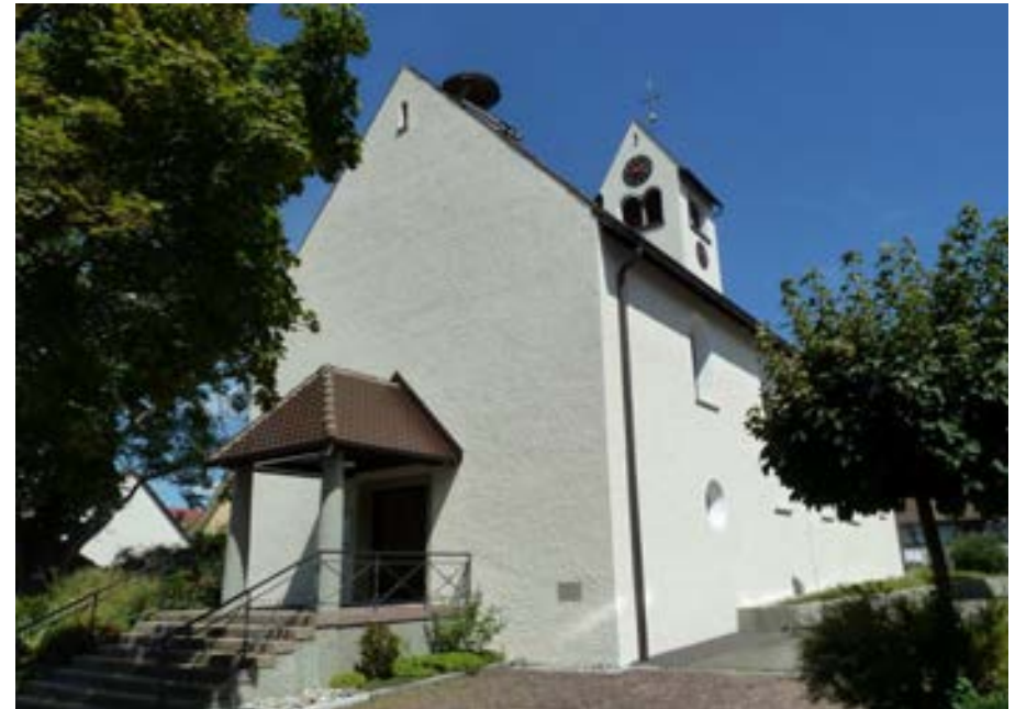
Südwestansicht der Kirche