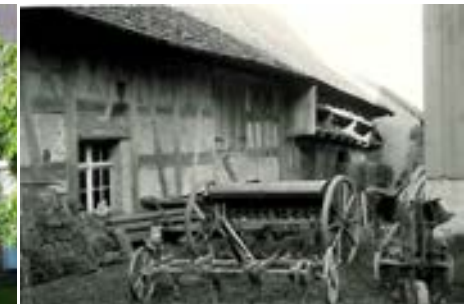
Südansicht im Jahr 1969