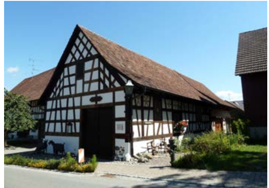
Südwestansicht des Trottengebäudes