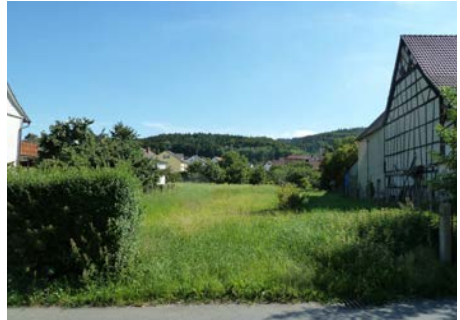
Historische Gärten zwischen Vorderer Hörstraße 2 und 6, Blick nach Süden