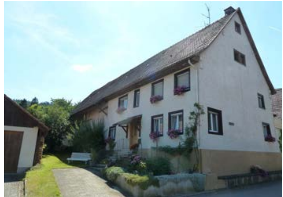
Nordostansicht, an der Giebelseite zeichnen sich die Balkenköpfe der Fachwerkkonstruktion ab