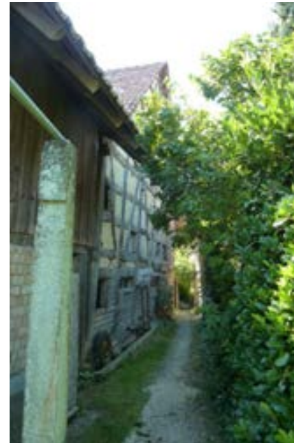
Historischer Weg auf Höhe Schienerbergstraße 21a, Blick nach Westen