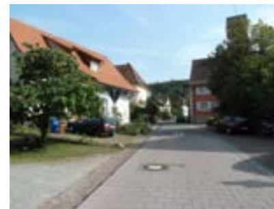
Blick nach Süden auf Höhe Gebäude 1