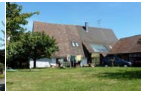
Westansicht mit tief liegender Trauflinie