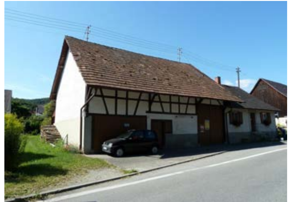
Nordostansicht mit Ökonomieteil links und Wohnteil rechts