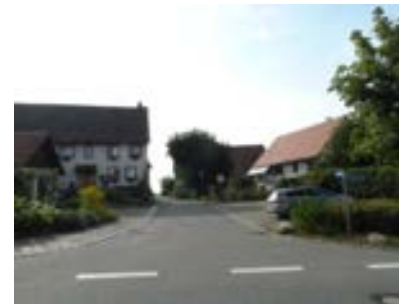
Blick nach Westen Höhe Schienerbergstraße