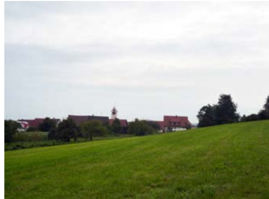
Historische Streuobstwiese am südwestlichen Ortsrand „Petisgarten“