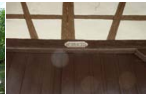
Inskript über dem Scheunentor: 1780